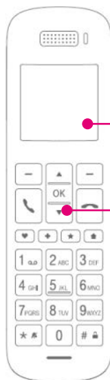
Großes beleuchtetes Farbdisplay