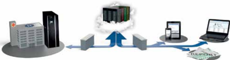
Eaton kaukovalvontamoduulit yhdistävät UPS-laitteiston ja valvontapalvelimen. Järjestelmä on suojattu tehokkaasti palomuurilla ja kryptatulla etäyhteydellä.