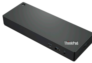
ThinkPad® Workstation Thunderbolt™ 4 Dockingstation Artikelnr.: 40B00300xx