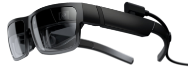
ThinkReality® A3 XR1 3G+32G