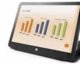
HP EliteDisplay S140u 14", 16:9, HD+ Ref. G8R65AA

Spezialanforderungen bedingen Speziallösungen – und solche haben wir bereits vorbereitet: Ein 14" Monitor für unterwegs, ein 23" Monitor mit Touch-Funktion, ein kommerzielles 3D Display, ein 30" Display im 16:10 Format und ein gestandenes 34" Curved Display. Wählen Sie Ihr Modell – ganz nach Ihren Wünschen und individuellen Bedürfnissen ausgerichtet.