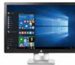
HP EliteDisplay E242 Ref. M1P02AA