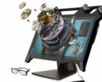
HP Zvr Display 23,6", 16:9, FHD Ref. K5H59A4