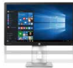
HP EliteDisplay E232 Ref. N2Q02AA