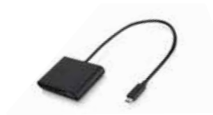
HP USB Type C™ Adapter Ref. Y5S33AA