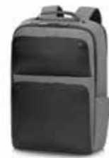
HP Executive 17.3" Black Backpack Ref. P6N23AA