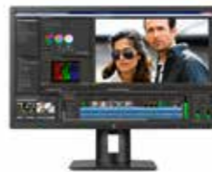
HP Z32x Display Ref. M2D46A4