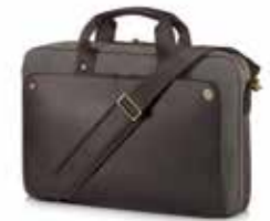
HP Executive Top Load 15.6" Braun Ref. P6N19AA