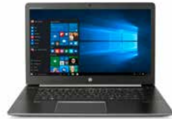
HP ZBook Studio