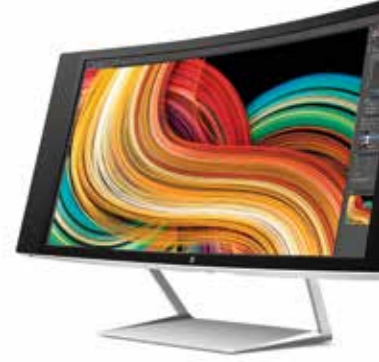
HP Z34c 34", 21:9, WQHD Ref. K1U77A4