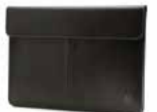
HP Executive Leather Sleeve Ref. M5B12AA