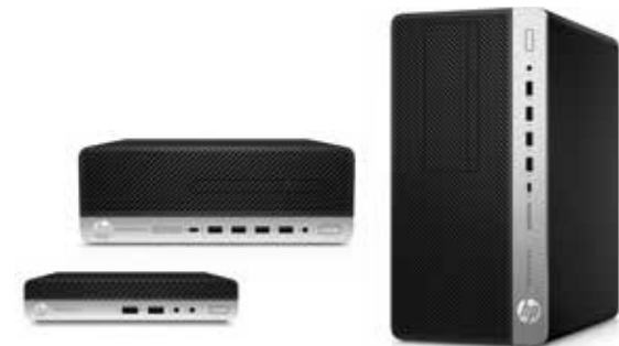
HP ProDesk Serie