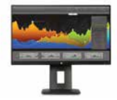
HP Z23n Display Ref. M2J79A4