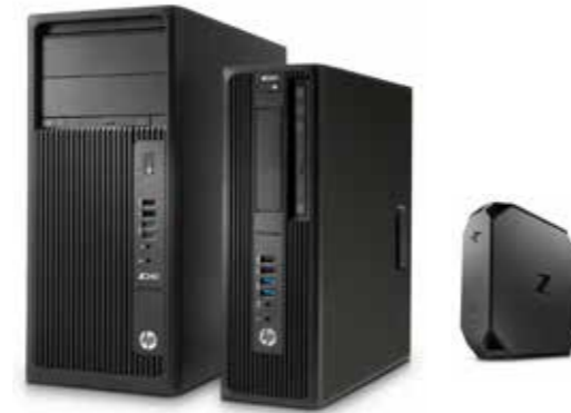
HP Z Desktop Workstation