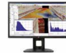
HP Z27s Display Ref. J3G07A4