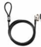
HP Keyed Cable Lock Ref. T1A62AA