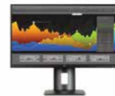
HP Z27n Display Ref. K7C09A4