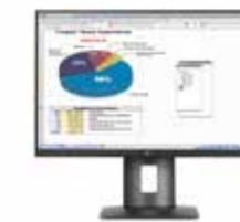
HP Z24n Display Ref. K7B99A4