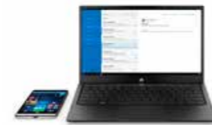
HP Elite x3 Lap Dock Ref. Y1M47EA