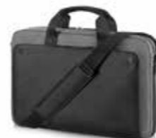
HP Executive 15,6" Black Top Load Ref. P6N18AA