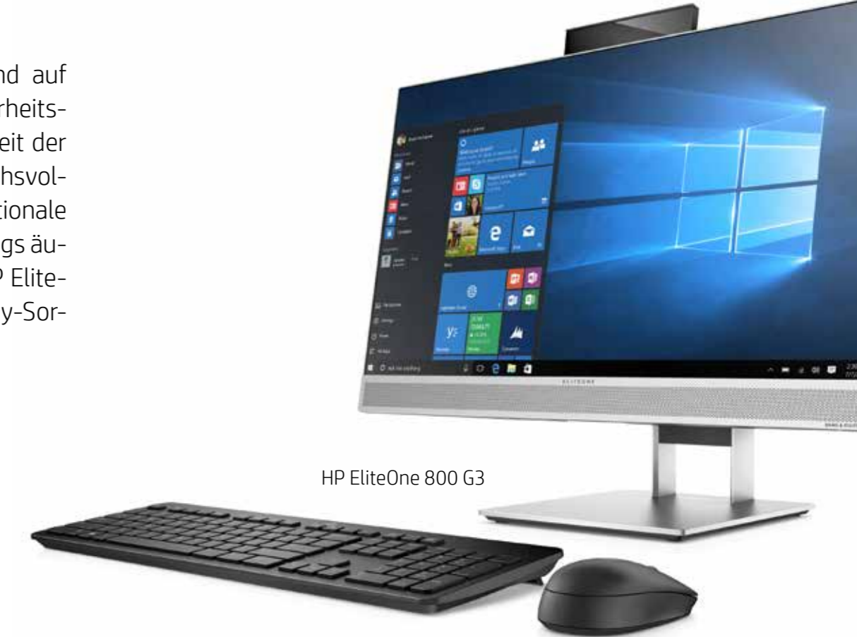
HP EliteOne 800 G3

Bildschirmgrößen: - 24" HP ProOne 440 - 21" HP ProOne 600 - 24" HP EliteOne 800