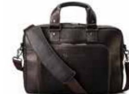
HP Executive Top Load Leather Case Ref. T9H72AA