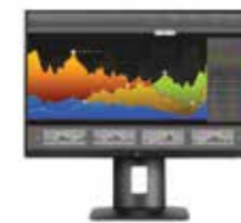
HP Z24nf Display Ref. K7C00A4