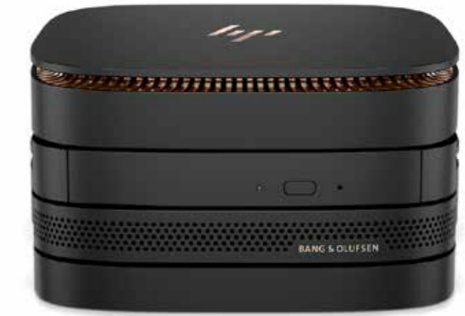
HP Elite Slice