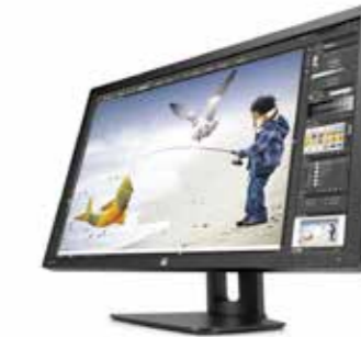
HP Z30i Display 30", 16:10, WQXGA Ref. D7P94A4