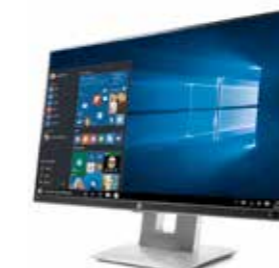
HP EliteDisplay E230t 23", 16:9, FHD Ref. W2Z50AA