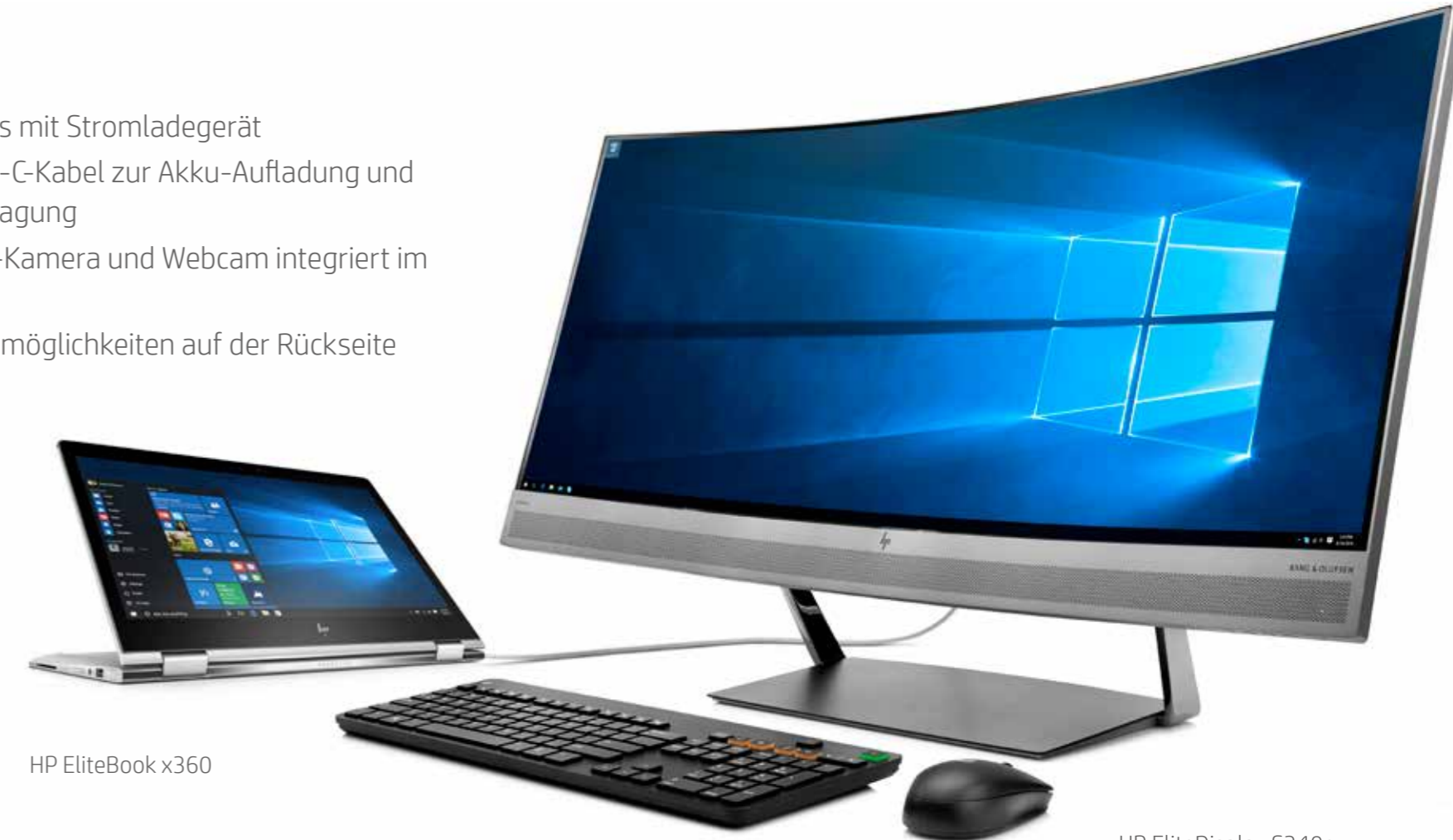
HP EliteBook x360