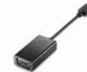
HP USB-C to VGA Adapter Ref. N9K76AA