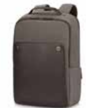
HP Executive Brown Backpack Ref. P6N22AA