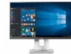
HP EliteDisplay E230t Ref. W2Z50AA