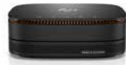
HP Elite Slice