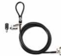
HP Dual Head Keyed Cable Lock Ref. T1A64AA