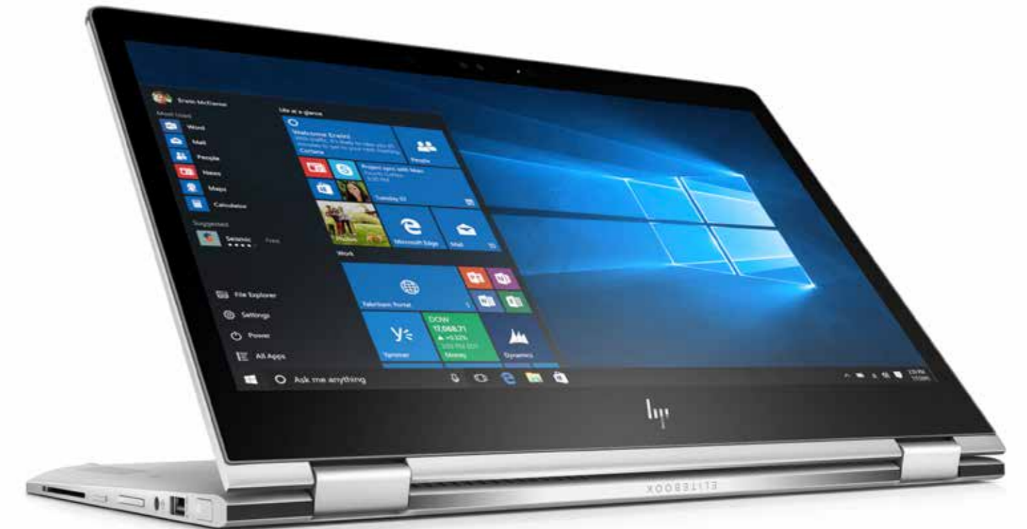
HP EliteBook x360 1030 G2

Innovative Premium-Funktionen im edlen Design: Mit unserem beeindruckenden Computing-Portfolio bieten wir dem Anwender ein erstklassiges Produkterlebnis. Dank 360°-Funktionalität und individuellen Anwendungsmodi verbunden mit neusten Sicherheitsfunktionen und bemerkenswerter Audioqualität bieten wir kompromisslose Leistung für höchste Ansprüche.