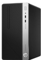
HP 400 G4 (PN: 1JJ56EA)