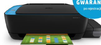
HP Ink Tank 319 (PN: Z6Z13A)