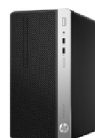
HP 400 G4 (PN: 1JJ50EA)