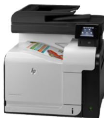
HP LJ Pro Color MFP M570dn (PN: C2271A)