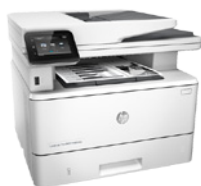
HP LaserJet Pro MFP M426fdn (PN: F6W14A)