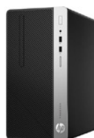
HP 400 G4 (PN: 1EY27EA)