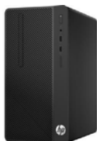
HP 290 G1 (PN: 3KU29EA)

HP zaleca system Windows 10 Pro w przypadku rozwiązań biznesowych