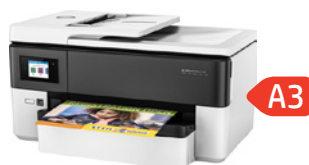
HP OfficeJet Pro 7720 Wide Format Prntr (PN: Y0S18A)