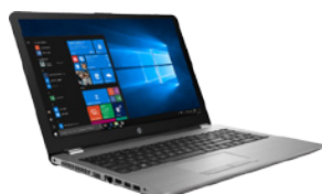
HP 250 G6 (PN: 1WY37EA)