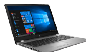
HP 250 G6 (PN: 3QM11ES)