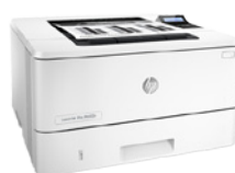
HP LaserJet Pro M402dne (PN: C5J91A)