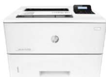
HP LaserJet Pro M501dn (PN: J8H61A)