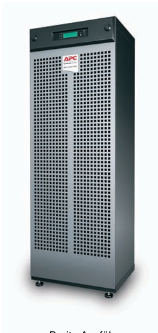
Breite Ausführung (15/20/30/40 kVA)