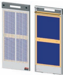
Einfach austauschbare Luftfilter