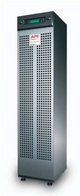
Schmale Ausführung (15/20 kVA)

Eine leistungsstarke USV-Serie, mit erstklassigem Wirkungsgrad und optimierter Stellfläche – für alle kommerziellen, technischen und industriellen Anwendungsbereiche