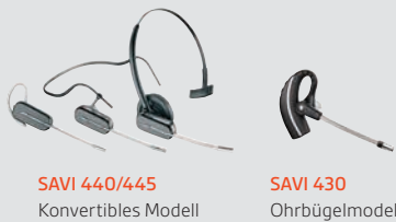
SAVI 440/445 Konvertibles Modell

*Für Savi 440: Unbegrenzte Sprechzeit mit exklusivem Auflade- und Halterungskit (separat erhältlich). Aufladokit wird mit Savi 445 geliefert. Ein zusätzlicher Akku ist separat erhältlich. Für unbegrenzte Sprechzeit, sowie um 2 Akkus gleichzeitig aufladen zu können, benötigen Sie entweder eine Deluxe-Ladestation mit Akkus (84601-01) oder ein USB-Deluxe-Ladeset (84603-01). Beide sind separat erhältlich.