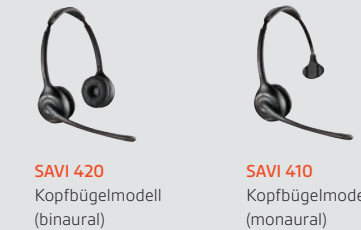
SAVI 420 Kopfbügelmodell (binaural)